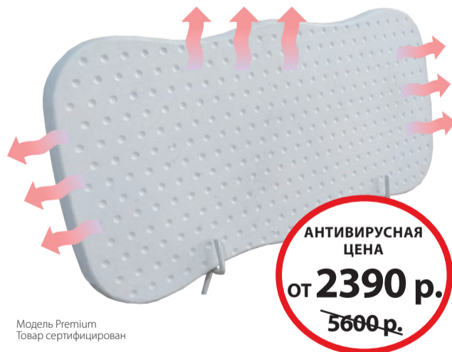
Модель Premium Товар сертифицирован

Поэтому такой обогреватель не только абсолютно безопасен, но и оказывает благотворное влияние на здоровье человека. При всём при этом он в 5 раз экономичнее масляных обогревателей – мощность всего 400 Вт вместо 2000 Вт. А с терморегулятором мощность снижается до 100 Вт! До рабочей температуры обогреватель нагревается уже за 15 минут, а остывает медленно в течение часа. Его можно применять в помещениях, где есть дети и домашние животные. Можно греть ноги, спину, сушить фрукты, ходить по нему. На российском рынке есть несколько производителей кварцевых обогревателей. Немецкая техника всегда славилась своей надёжностью и качеством. Компания WarmHoff является единственным производителем на российском рынке, кто производит кварцевые обогреватели по немецким технологиям. Такие обогреватели отличаются высокой надёжностью. Срок эксплуатации обогревателя не ограничен и составляет не менее 25 лет. Производитель даёт высокую гарантию 5 лет! Более 100 тыс. покупателей ежегодно выбирают марку WarmHoff.