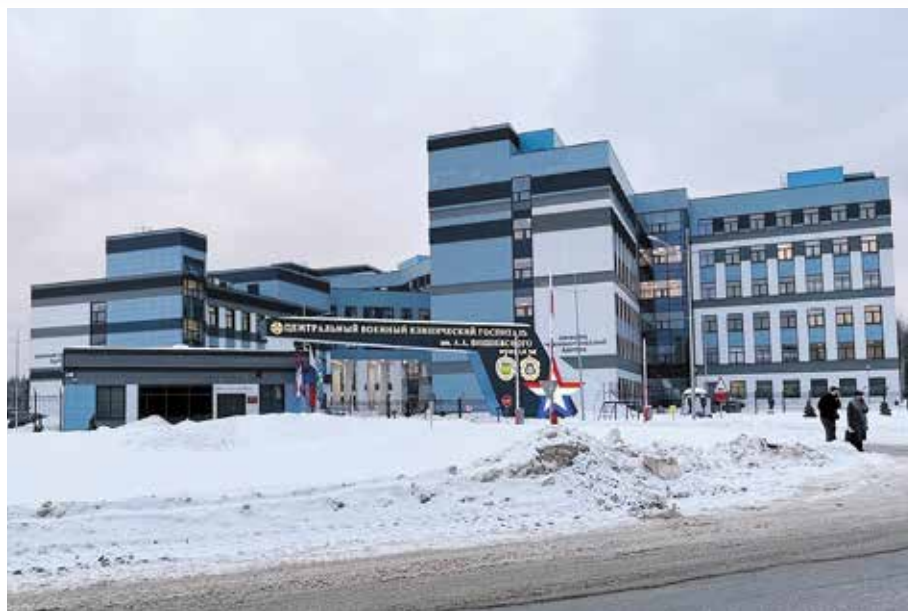
Филиал № 8 ФГБУ «НМИЦ ВМТ им. А.А. Вишневого» Минобороны России в г. Мирный Архангельской области

ющих деятельность в сфере обязательного медицинского страхования, во внеочередном порядке. Дополнительной гарантией (не в рамках ОМС) в Архангельской области является обеспечение участников СВО зубным протезированием за счет бюджетных ассигнований областного бюджета.