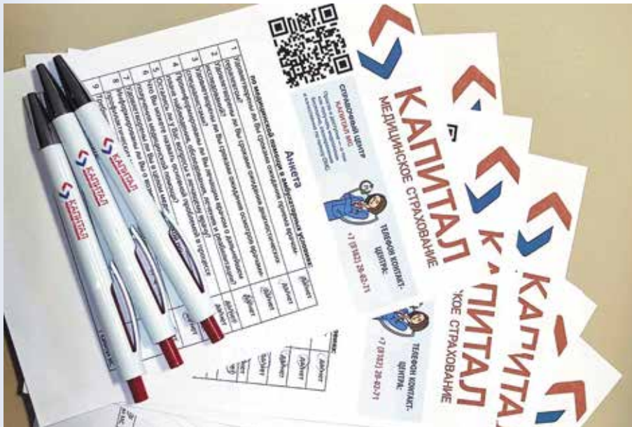
Анкета изучения удовлетворенности оказанием медицинской помощи

мероприятия способствует формированию осознанного отношения к своему здоровью и достижению целей нацпроекта «Продолжительная и активная жизнь».