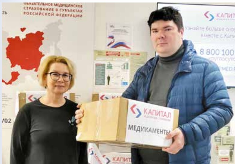
Сотрудники Архангельского филиала принимают участие в благотворительной акции «Защитнику от всего сердца», организованной Губернаторским центром

на региональном уровне, форумах ветеранов и волонтеров СВО Архангельской области, неделях приема граждан, участвуя в акциях по сбору и отправке гуманитарной помощи военнослужащим на фронт и жителям пострадавших регионов.