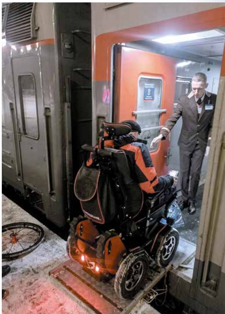
Организация транспортного сопровождения ветерана боевых действий в ФГБУ «Национальный медико-хирургический центр им. Н.И. Пирогова» Минздрава России

Маломобильным участникам СВО Архангельский филиал оказывает содействие в подготовке к госпитализации, прохождении необходимых исследований, разрешении