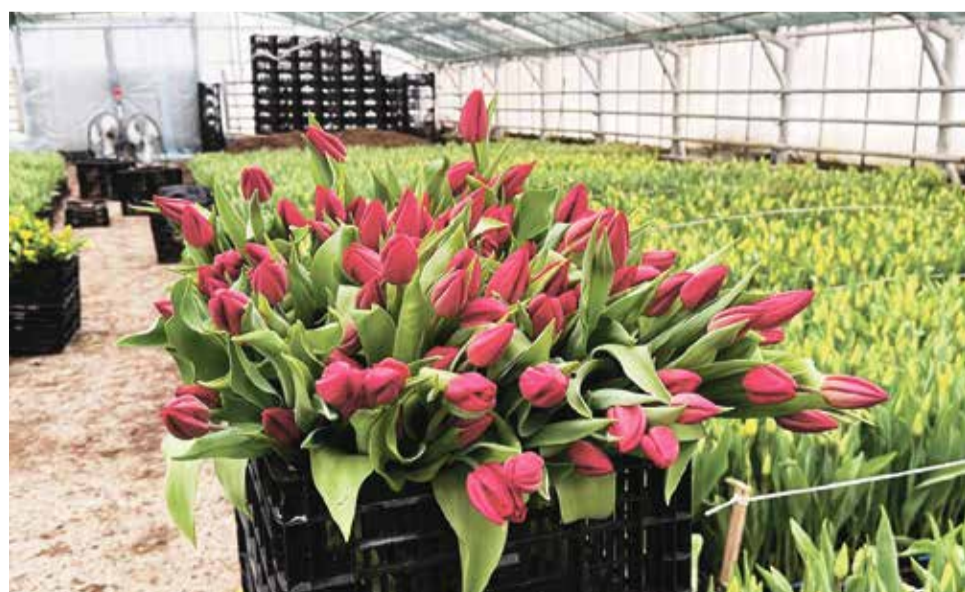
Цветы из теплиц племзавода «Принева» – одного из крупнейших сельскохозяйственных предприятий не только Всеволожского района, но и России.

■ АВТОР Светлана ЗАВАДСКАЯ